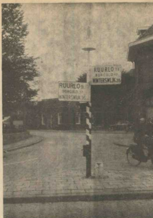
Welke is de juiste richting?

Onlangs heeft de bewegwijzeringsdienst aan de wegwijzer bij de Ned. Herv. Kerk enkele nieuwe borden aangebracht. Bij het plaatsen hiervan werd een fout gemaakt, zoals u op de bovenstaande plaat, die wij hiervan maakten, kunt zien. Inmiddels zijn de juiste borden aangebracht.