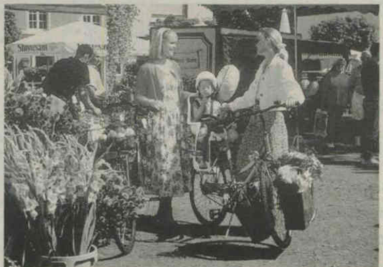
Boodschappen doen op de fiets

De kans dat een fiets met een tas op het stuur omvalt, wordt een stuk kleiner met het balhoofdstel van Nexus. Dat is uitgerust met een roterende ring, die de voorvork vastzet als de fiets geparkeerd staat, de fiets valt dan niet zo gemakkelijk meer om.