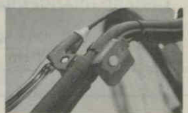
De dynamo-switch is met één druk op de knop te bedienen

Een onderzoek afgelopen jaar onder ruim 1.400 slachtoffers van fietsongevallen leert dat het eigen gedrag (28 procent) en het gedrag van andere weggebruikers (27 procent) de belangrijkste oorzaken zijn van de ongelukken. Slechts 7 procent van de ongevallen is het gevolg van een mankement aan de fiets. Ook een slecht wegdek (14 procent) is vaak oorzaak van een fietsongeluk.