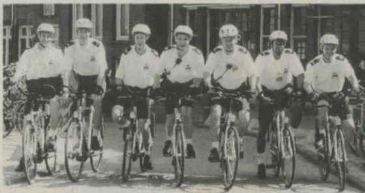
Het politieteam op de fiets