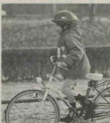
Veel beginnende fietsertjes dragen een helm bij het fietsen

Twee zinnen uit een ANP-bericht: Van alle kinderen die in het ziekenhuis na een verkeersongeval aan verwondingen worden geholpen, is 80 procent fietser. Van de ernstig gewonden (vooral schedel- en hersenletsel) is 60 procent fietser.