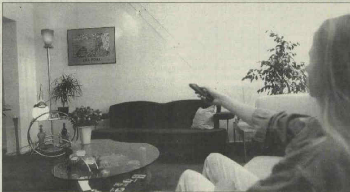
Niet alleen audio-visuele apparatuur, maar ook verlichting laat zich tegenwoordig gemakkelijk en comfortabel vanuit de luie stoel of vanaf de bank bedienen.

'Leuk is het niet als je merkt dat je ouders moderner zijn dan jezelf. Het zou toch zo moeten zijn dat ze door mij op allerlei nieuwe ontwikkelingen gewezen worden. En dat ze vervolgens alleen maar kunnen verzuchten hoe knap men tegenwoordig wel niet is. Maar bij mijn eerste bezoek aan het nieuwe huis van mijn ouders was ik het die zich voortdurend verbaasde. Bewegingsmelders, elektronische jaloezie besturing, veiligheidscontactdozen; wat betreft wooncomfort liggen mijn ouders lichtjaren op mij voor.'