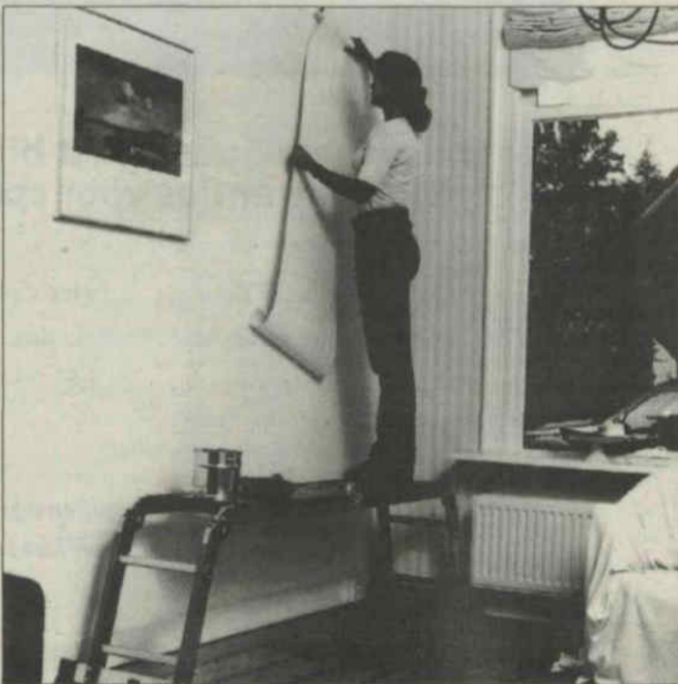
De Varitrex Indoor van Altrex is handig als u gaat behangen. U heeft beide handen vrij.

der vormen met een maximale lengte van 1,40 meter. Als enkelvoudige rechte ladder reikt de Varitrex Indoor zelfs ver genoeg om tot 4 meter hoog te kunnen werken. Met het los bijgeleverde tweedelige platform is de ladder bovendien in een handomdraai weer omgevormd tot een stevige steiger met een stahoogte van 60 cm. Dat is handig als u het plafond wilt sauzen of gaat behangen. Bijvoorbeeld met de behangstrook in de handen kunt u precies de uiteinden in de hoek tussen muur en plafond plakken. Maar de Varitrex Indoor is ook heel goed in een trapgat te gebruiken. U staat dan toch stevig en u kunt zo stabiel en heel veilig klussen.