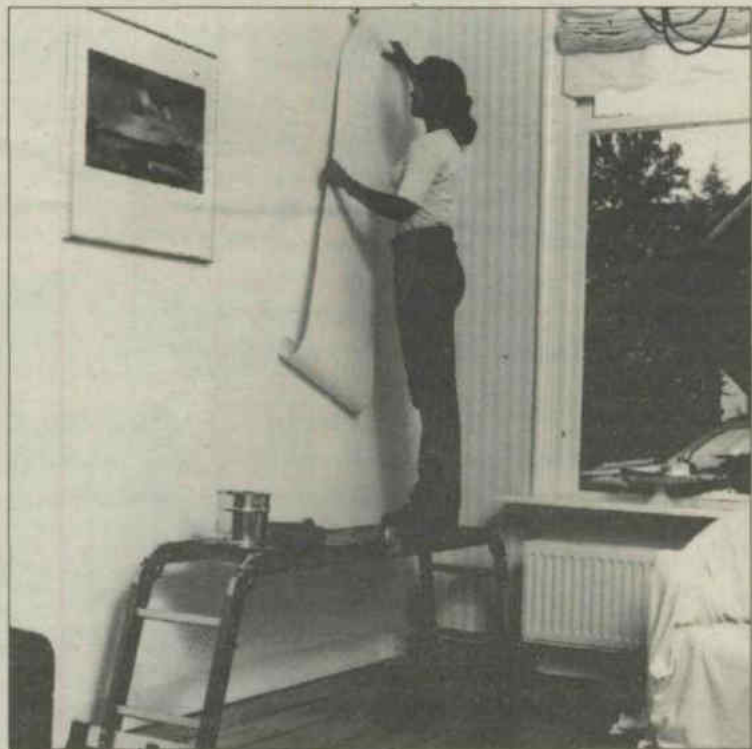
De Varitrex Indoor van Altex is handig als u gaat behangen. U heeft beide handen

der vormen met een maximale lengte van 1,40 meter. Als enkelvoudige rechte ladder reikt de Varitrex Indoor zelfs ver genoeg om tot 4 meter hoog te kunnen werken. Met het los bijgeleverde tweedelige platform is de ladder bovendien in een handomdraai weer omgevormd tot een stevige steiger met een stahoogte van 60 cm. Dat is handig als u het plafond wilt sauzen of gaat behangen. Bijvoorbeeld met de behangstrook in de handen kunt u precies de uiteinden in de hoek tussen muur en plafond plakken. Maar de Varitrex Indoor is ook heel goed in een trapgat te gebruiken. U staat dan tóch stevig en u kunt zo stabiel en heel veilig klussen.