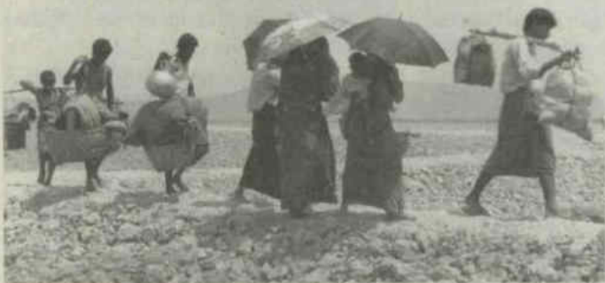
Honderdduizend Birmezen op de vlucht voor onderdrukking en geweld.