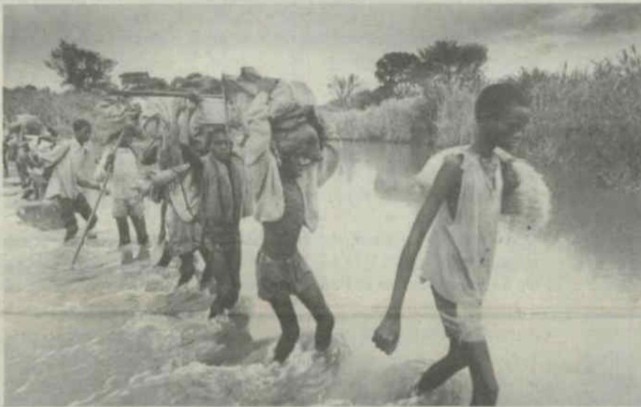
Miljoenen vergeten vluchtelingen op de vlucht voor onderdrukking en geweld.