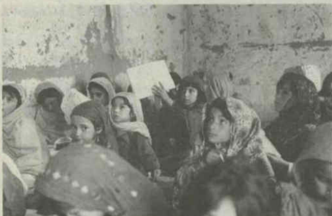
Afghaanse vluchtelingen meisjes gaan naar school in het vluchtelingenkamp.