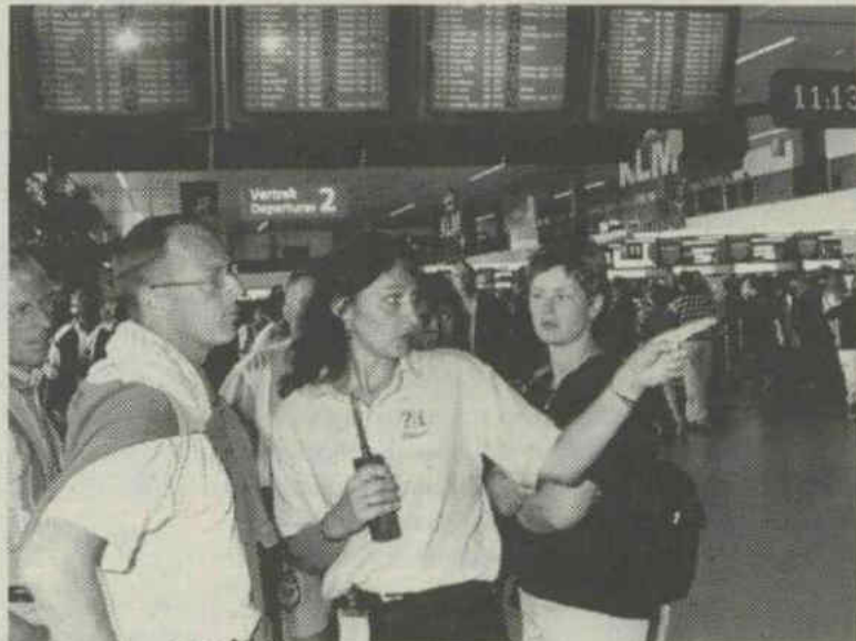
De service assistants zijn herkenbaar aan hun gele blouse of overhemd, met op de rug een grote I met een vraagteken.

Een andere extra voorziening tijdens de zomerdrukke zijn de mobiele servicebalies die worden geplaatst aan het begin van de meest drukbezochte pieren. Bij deze balies kunnen passagiers hun vragen voorleggen aan inlichtingenmedewerkers of service assistants. Voor andere taken die ook direct met de vakantiepiek samenhangen wordt extra personeel in dienst genomen. Denk bijvoorbeeld aan het in de gates houden van de drukke rolpaden, zodat zich daar geen stagnaties voordoen.