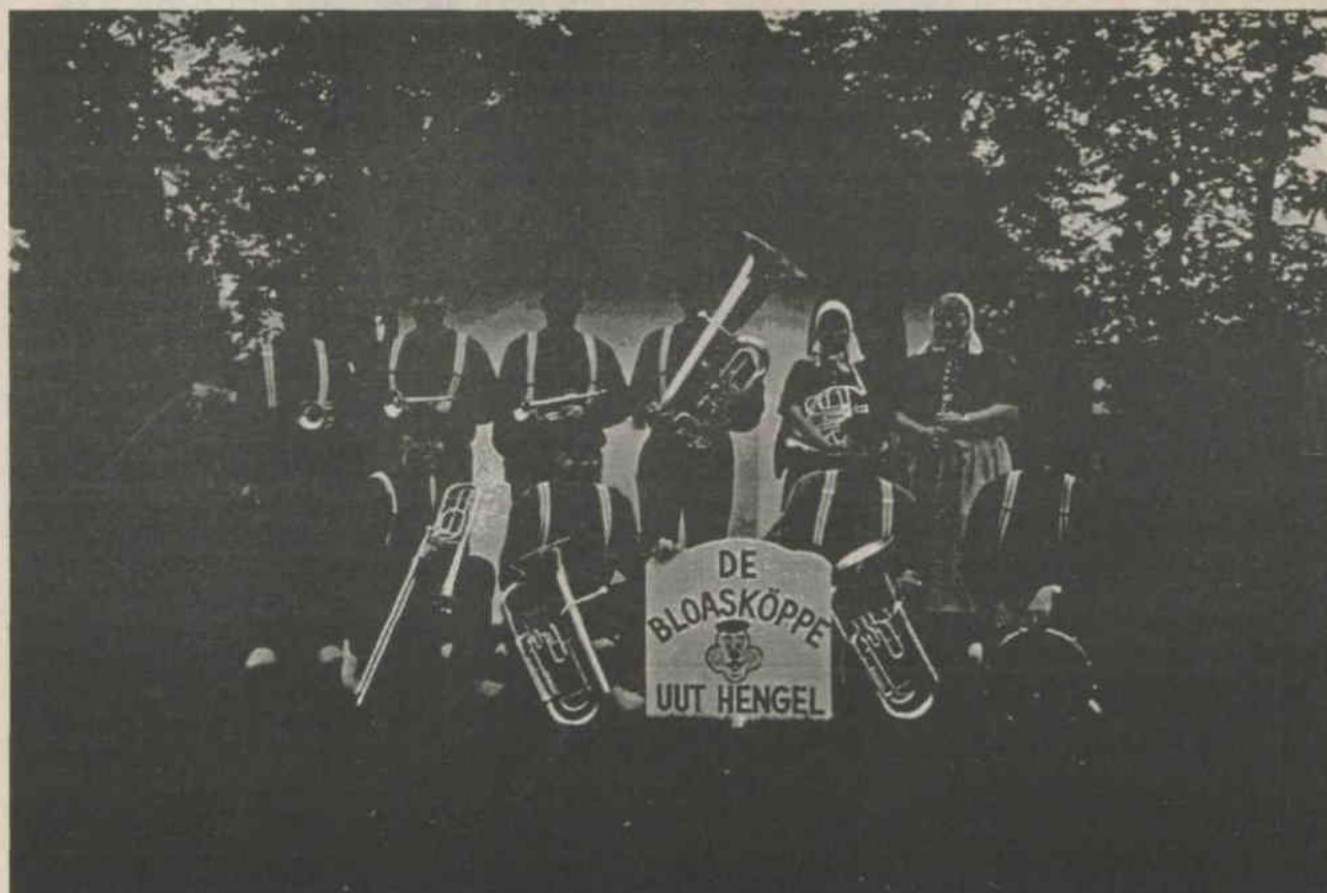
Boerenkapel "De Bloasköppe", gefotografeerd op een uniek plekje in Hengelo Gld. bij het Bleekhuisje.

Woensdag 9 augustus a.s. zullen in de Kerkstraat te Hengelo Gld. vrolijk klanken klinken. Om 19.30 uur begint dan een optreden van de boerenkapel de Bloasköppe in het kader van de doe-activiteiten van VVV-Hengelo Gld. De Boerenkapel is een onderdeel van de Chr. Muziekver. Crescendo en werd zo'n 25 jaar geleden opgericht en bestaat momenteel uit 12 enthousiaste muzikanten die een zeer breed repertoire van Egerländermuziek tot moderne dansmuziek en bekende meezingers brengen. De Bloasköppe verlenen vaak hun medewerking aan middagen bij zorg instellingen, optreden op braderiën, boerenbruiloften enz. Zo ook dit optreden op woensdagavond 19 augustus in de Kerkstraat. Het belooft weer een leuke en gezellige avond te worden en aan de enthousiaste muzikanten zag het niet liggen, zij gaan met vrolijke muziek het publiek vermaken. Kom in grote getale en geniet van het optreden van de Bloasköppe.