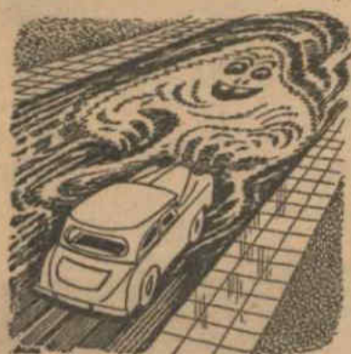
Gladder wegen; het slijpspoek ligt op de loer.

Pracht handen en nimmer ruw of schraal HAMEA Geleis Tube 95 ct. Het is de Homomelis die het 'm doet