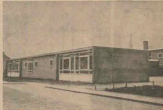
Vleugel R.K. School de Leer

Nuts-bibliotheek Hengelo Gld Inplaats van vrijdag 9 en 16 april op donderdag 8 en 15 april