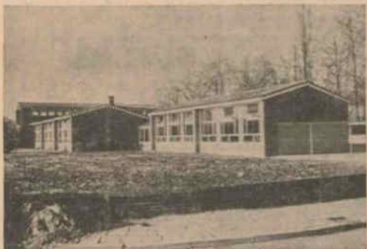
Vleugel Ds. Piersonschool